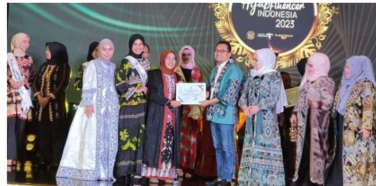
GALLERY BATIK JURUSAN