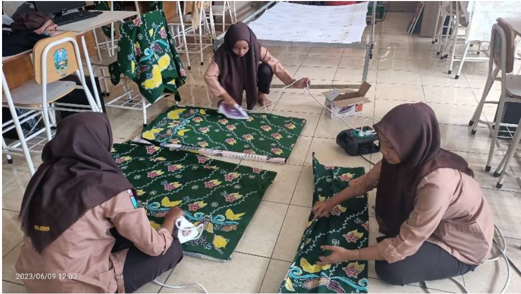
PROYEK BATIK PESANAN UNEJ