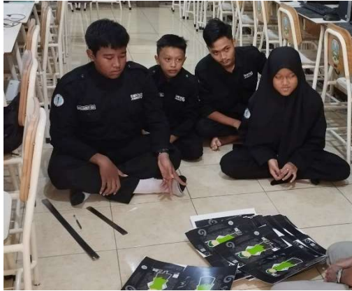
1000 PACKAGING BATIK PEMESAN : KKBT SMK6