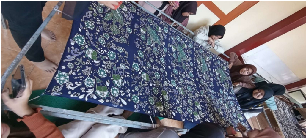
BATIK ENEM X PUTRI HIJAB INDONESIA 2023