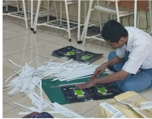
1000 STIKER AIR MINERAL PEMESEAN : ENERGI 6